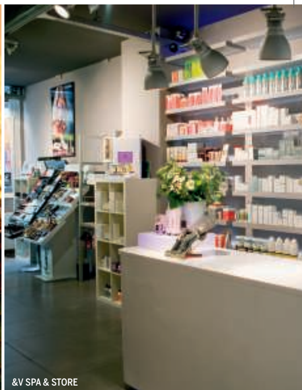
&amp;V SPA &amp; STORE