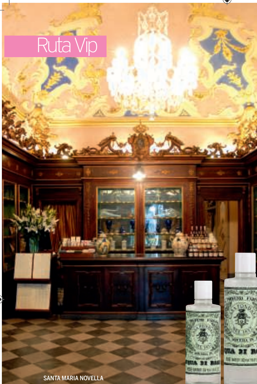
SANTA MARIA NOVELLA