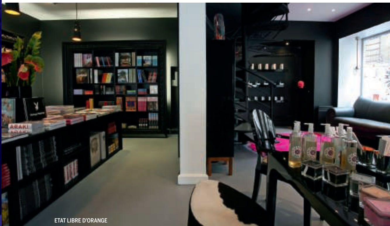
ETAT LIBRE D'ORANGE

Nos damos una vuelta por el mundo para descubrir los mejores centros de belleza actuales. Estas son las direcciones imprescindibles para las citas más exclusivas.