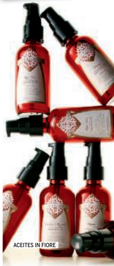
ACEITES IN FIORE

Entrégate a los grandes santuarios del relax total